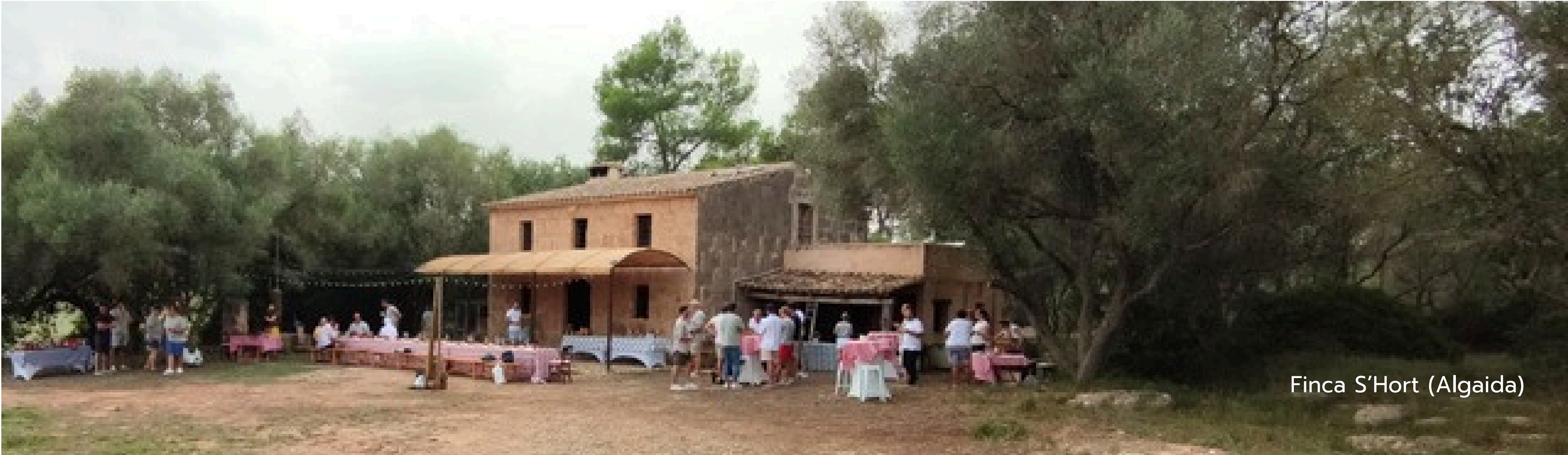
Finca S'Hort (Algaida)